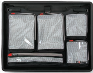
Lid Organizer Organisateur de couvercle