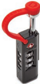
TSA Accepted Case lock Cadenas TSA pour mallette