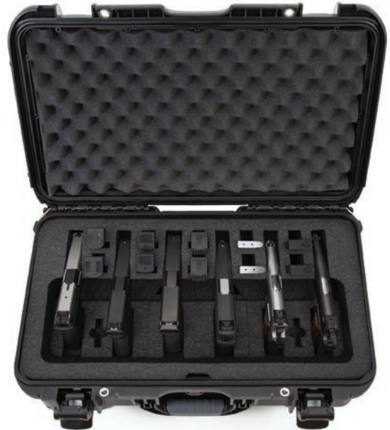
935 6UP Gun Case

Interior dimensions Dimensions intérieures L17.0" x W()11.8" x H6.4" L432mm x W()300mm x H163mm Exterior dimensions Dimensions extérieures L18.7" x W()14.8" x H7.0" L475mm x W()376mm x H178mm