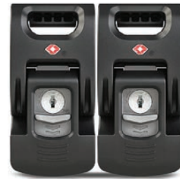
TSA Latch Retrofit Kit Ferroirs TSA PowerClaw