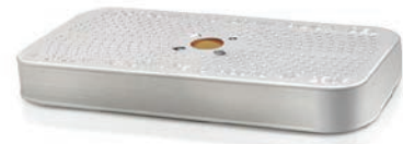
Desiccant Container Contenant desiccant