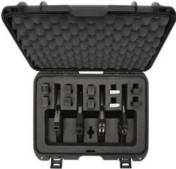
925 4UP Gun Case