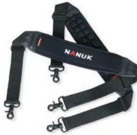
Shoulder Strap Sangle d'épaule