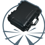
INDESTRUCTIBLE NK-7 Resin Résine NK-7