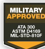
CERTIFICATIONS Laboratory Tested Tests en laboratoire