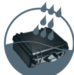
WATERPROOF IP67 Rated Étanchéité Norme IP67