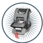
POWERCLAW Superior Latching System Système de verrouillage

Les photographes, vidéastes, pilotes de drones et passionnés font confiance à NANUK™ pour protéger leurs drones coûteux. La série pour drones NANUK™ est conçue pour fournir aux drones, contrôleurs, batteries et accessoires le niveau de protection maximal dans des valises de protection sur mesure. Chaque valise comprend une mousse à cellules fermées de haute qualité, prédécoupée, qui s'adapte spécifiquement aux modèles de drones DJI™ pour les loisirs, les professionnels et les entreprises. Conçues pour organiser, protéger, transporter et survivre dans des conditions difficiles, les valises rigides étanches NANUK™ sont impénétrables et indestructibles avec une coque en résine NK-7 légère et résistante et des systèmes de verrouillage PowerClaw supérieurs. Grâce au système exclusif et supérieur de fermeture et de verrouillage de NANUK™, le boîtier reste fermé et sécurisé jusqu'à ce qu'il soit prêt à être ouvert. Chaque valise de protection est livrée avec une poignée souple et une poignée ergonomique pour la rendre facile à transporter. Ils sont également dotés d'une quincaillerie en acier inoxydable et les poignées sont à ressort et se rétractent pour les garder hors de danger. Tous les boîtiers NANUK™ sont conformes aux spécifications MIL, équipés d'une soupape de décompression automatique et sont couverts par une garantie à vie.